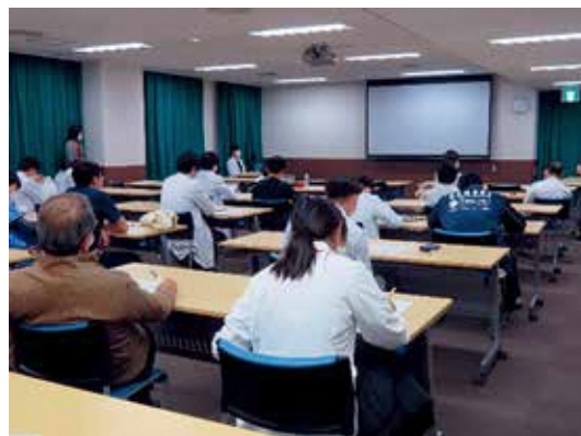
症例検討会（年７回）、ＣＰＣ（年５回）、 ２年目研修医による症例報告会（年２回）