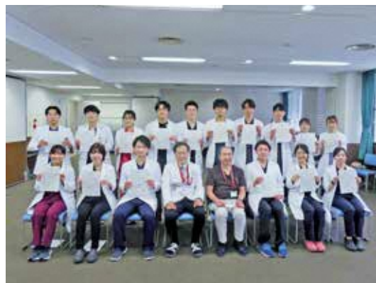
臨床研修修了式（３月）※写真は令和６年度のもの