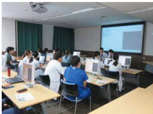
研修医オリエンテーション（４月）