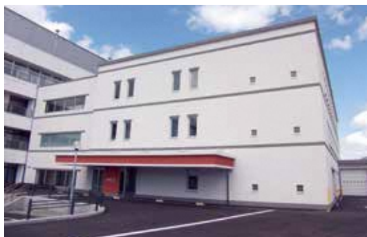
救命救急センター