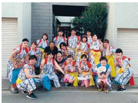
ねぶた祭り（8月）※写真は令和元年度のもの