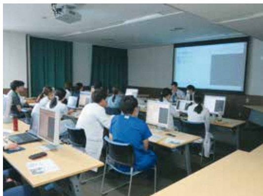
研修医オリエンテーション（4月）