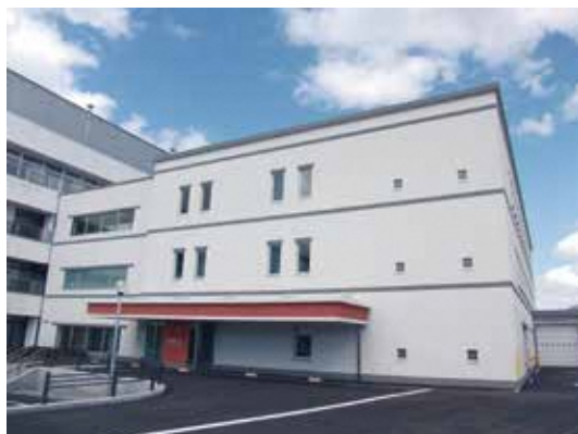
救命救急センター