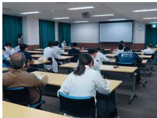
症例検討会（年7回）、C P C（年5回）、 2年目研修医による症例報告会（年2回）