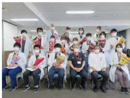
臨床研修修了式（3月）※写真は令和3年度のもの