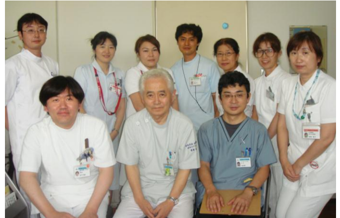
【緩和ケアチーム企画委員会】